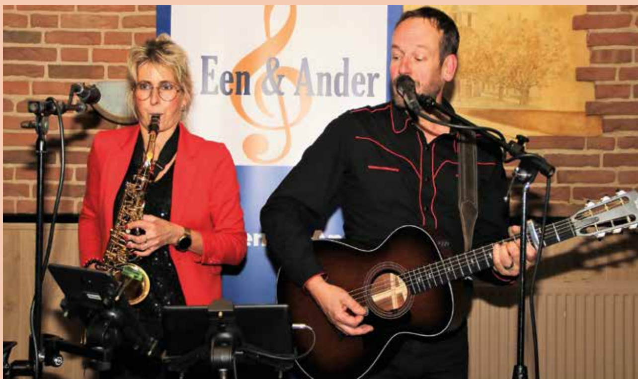
Duo "Een en Ander"