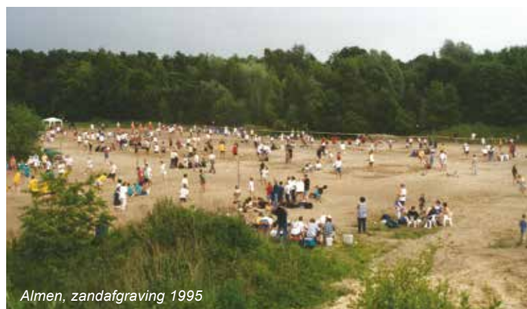
Almen, zandafgraving 1995